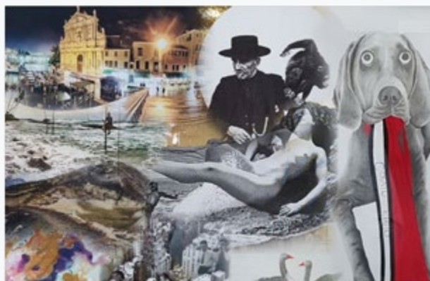
Collage aus diversen Ausstellungsstücken

Mit mehr als 250 Besuchern war diese Kunstausstellung zum wiederholten Male ein gesellschaftlicher Treffpunkt für Mandanten und Kunstinteressierte. Angeregte Gespräche und ein langer Abend für die teilnehmenden Kolleginnen und Kollegen zeugen von diesem Zuspruch.